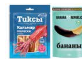
полимерная упаковка с печатью