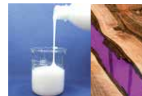
полимерные дисперсии и эпоксидные смолы