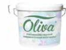
продукция для строи- тельного бизнеса