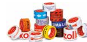
клеякие ленты с логотипом