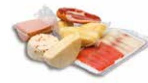
вакуумные и термоуса- дочные пакеты